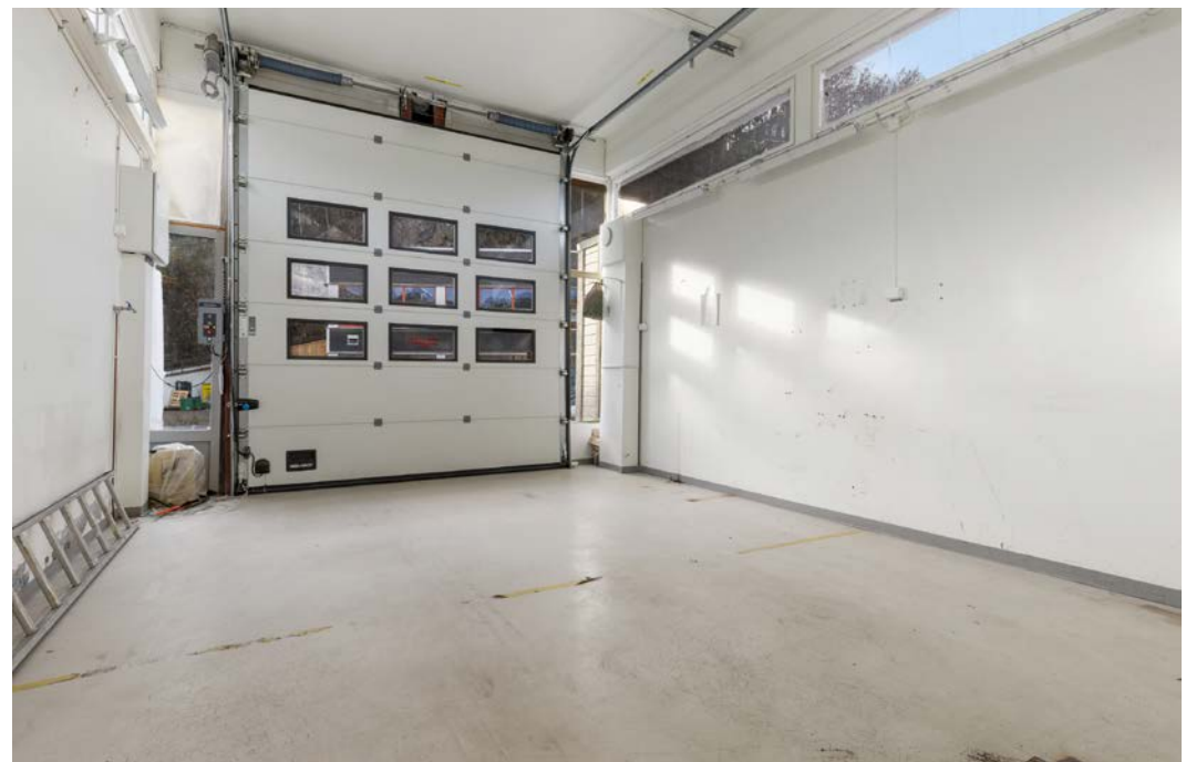
Verkstedshall med kjøreport.