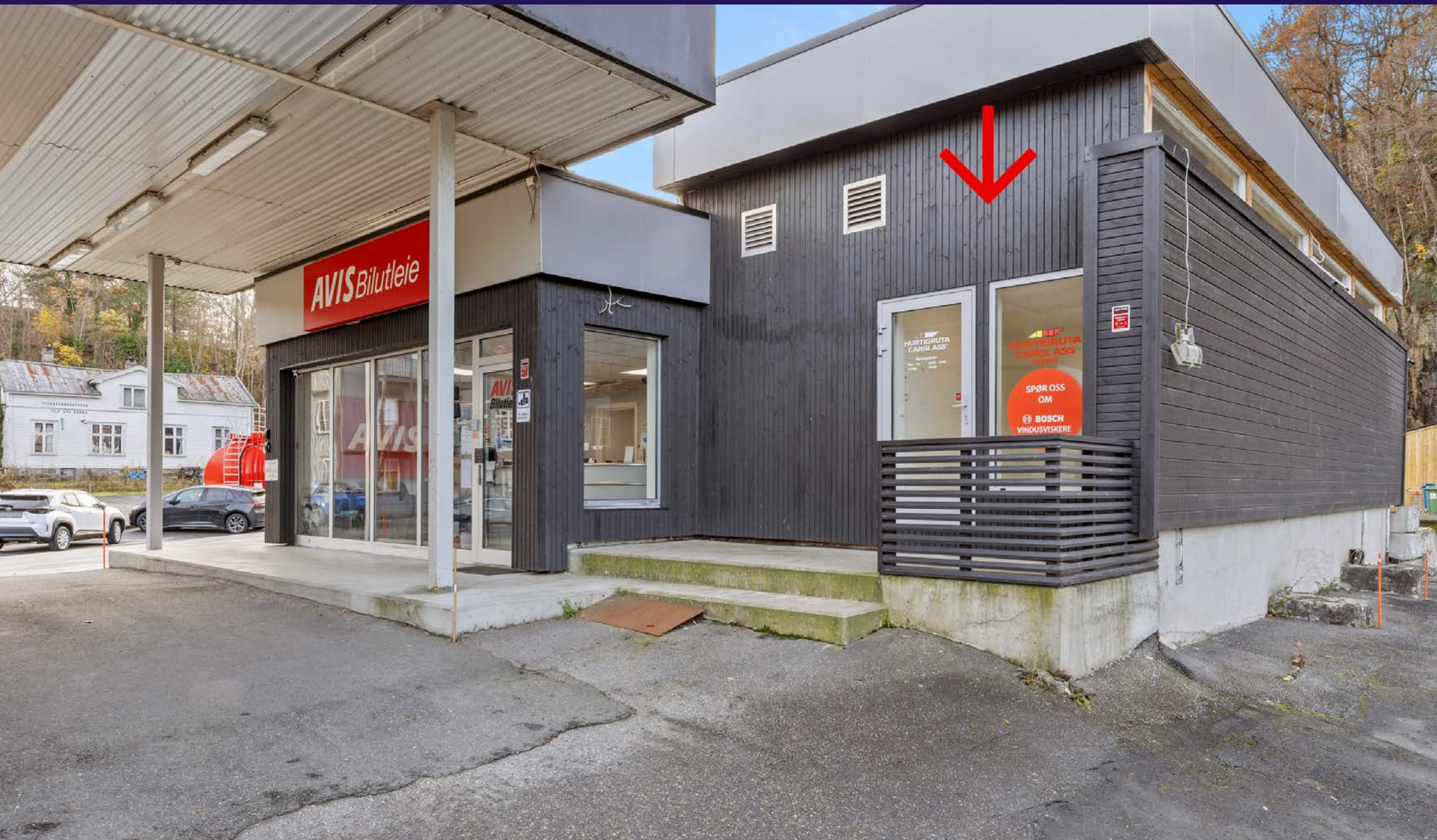
MYRENE/ARENDAL - NYRENOVERT VERKSTEDSHALL MED KONTOR. ARENDAL - Myreneveien 23 - Utleie