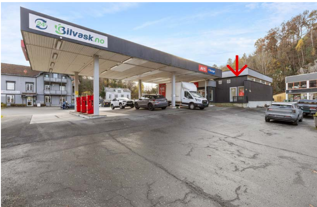
Meget sentral og godt profilert beliggenhet på Myrnene som ligger midt mellom Arendal sentrum og industriområdet på Stoa.