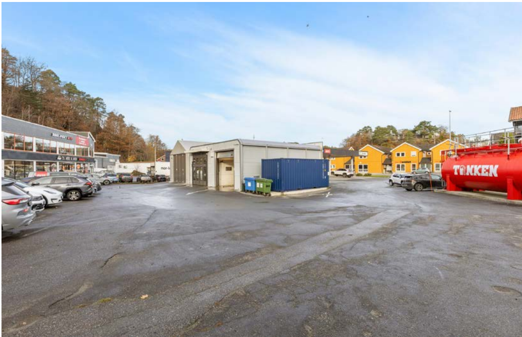
Uteområde. 3 parkeringsplasser kam medfølge leieforholdet.