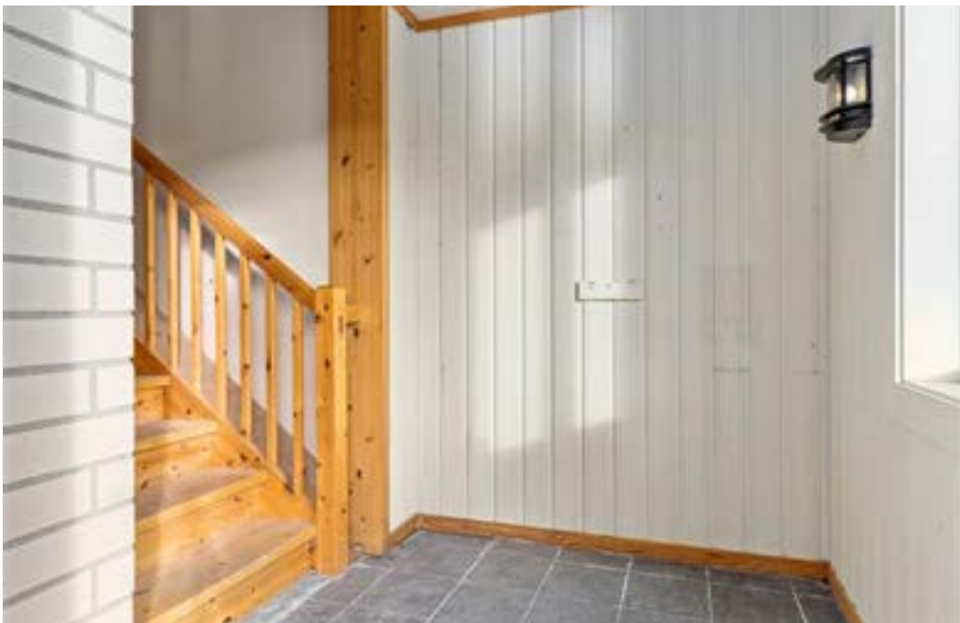
Inngang med trapp opp til 2.etg.