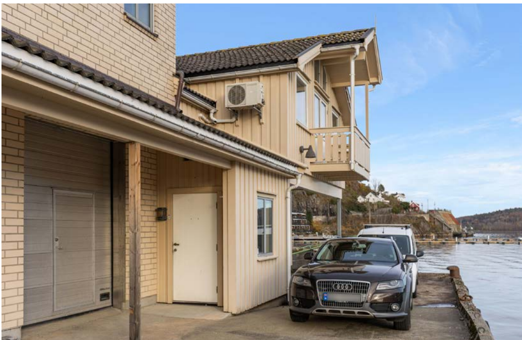
Sjønært og med utsikt til Tromøysundet. Lokalene ligger i 2.etg i kontorbygg.