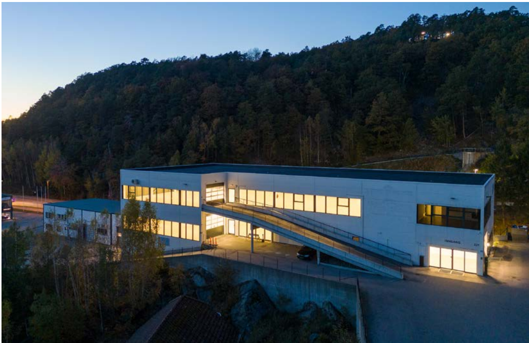
Mye vindusflater for god eksponering