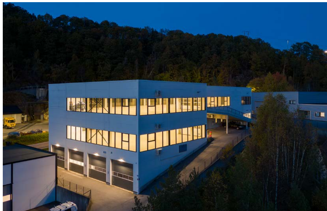
Nylig oppført med gode kvaliteter på bygg og uteområder