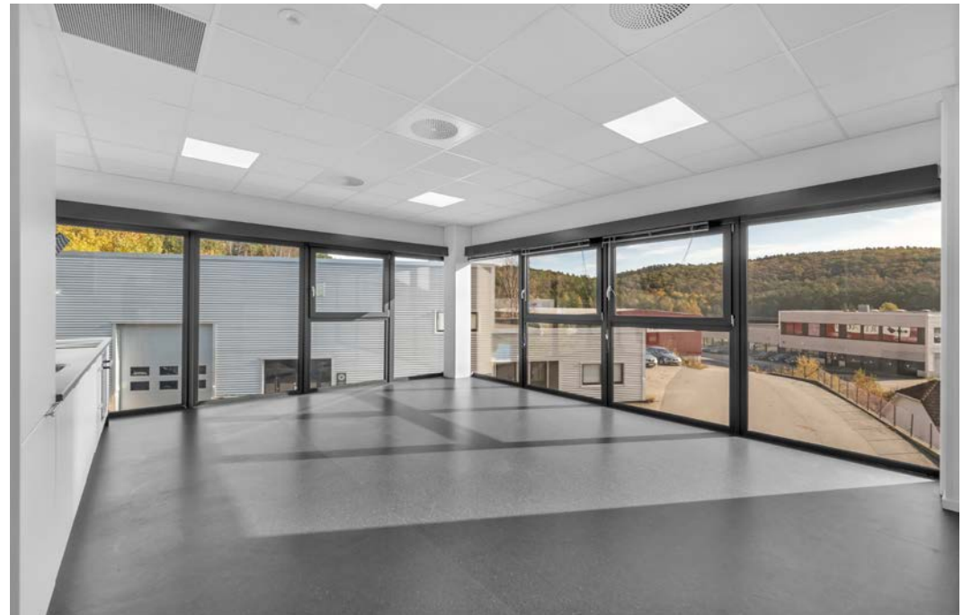
Trivelig kjøkken og pauserom