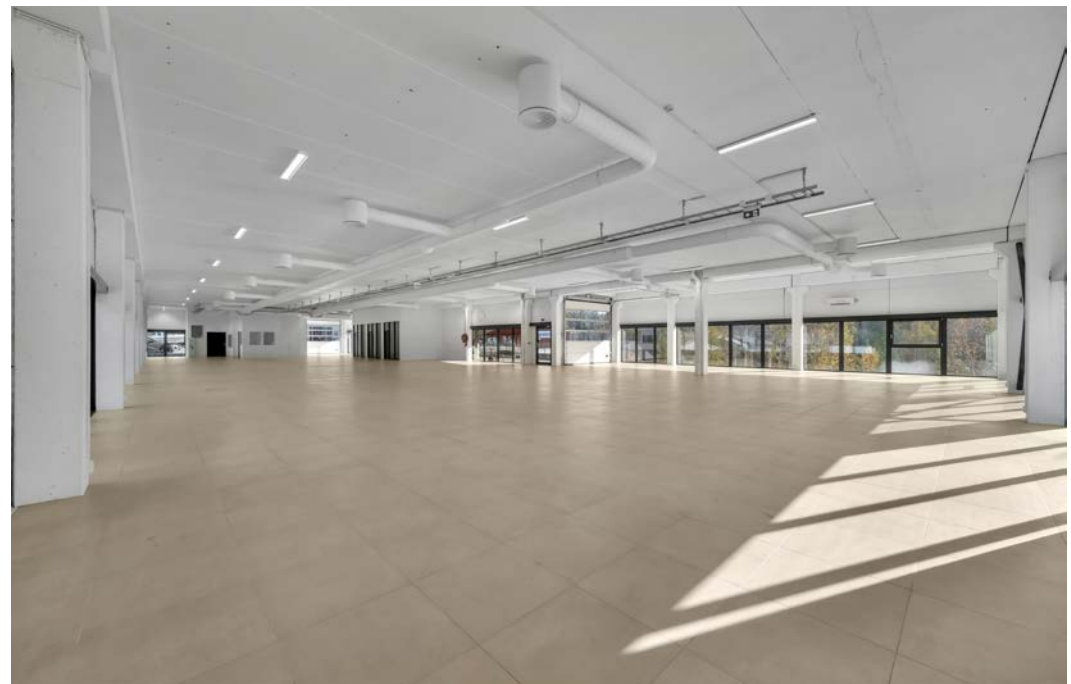
1 etasje med to porter