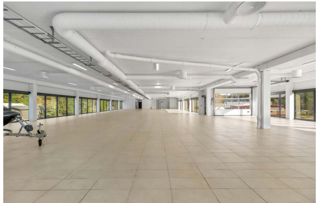
adkomst via rampe/port