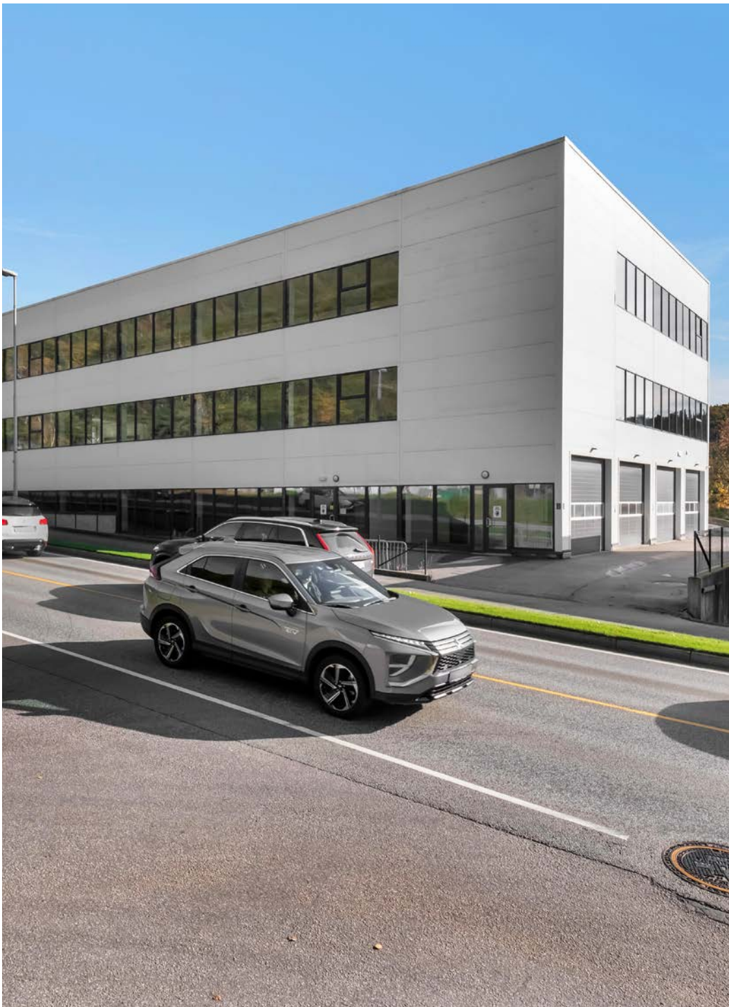
Bygget ligger langs hovedfartsåre inn til Sørlandssparken