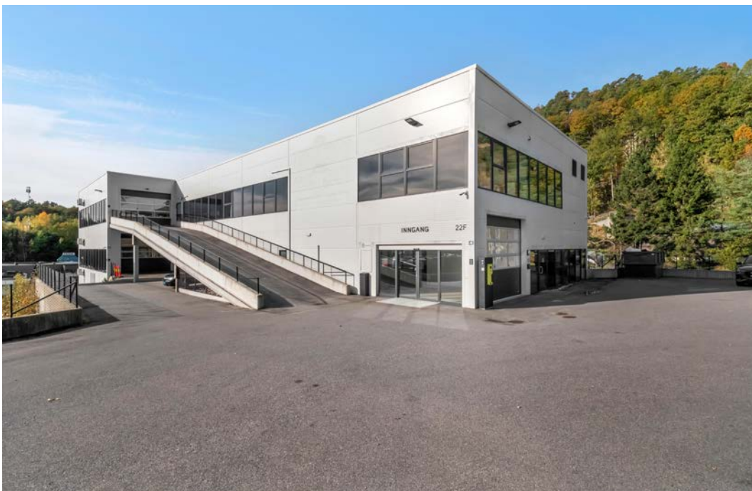
Port med innkjøring til hver etasje