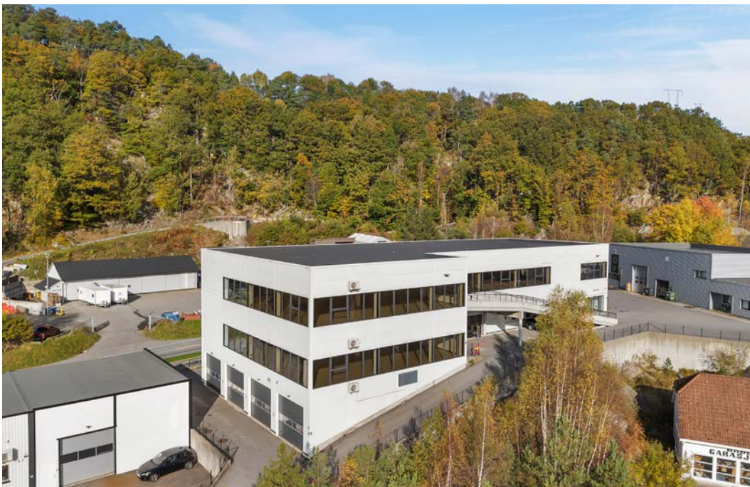
Bygget i 2021 med god teknisk standard