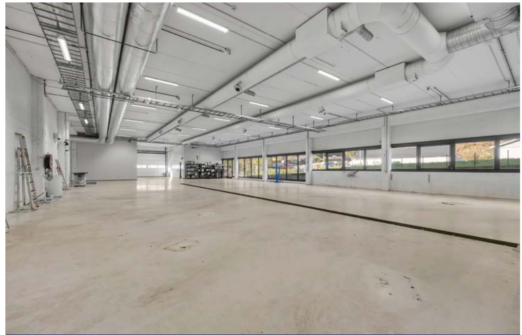
Underetasje med port og slukrenne - bygget har oljeutskiller