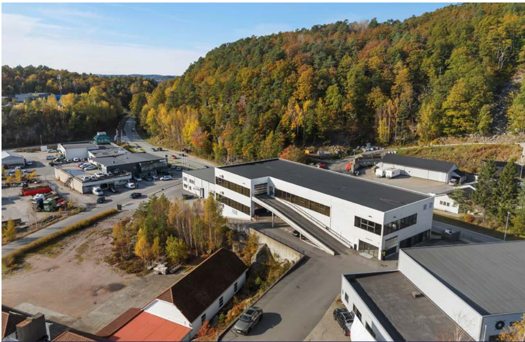
Bygget ligger i ytterste rekke mot Barstølveien og har meget god eksponering mot vei