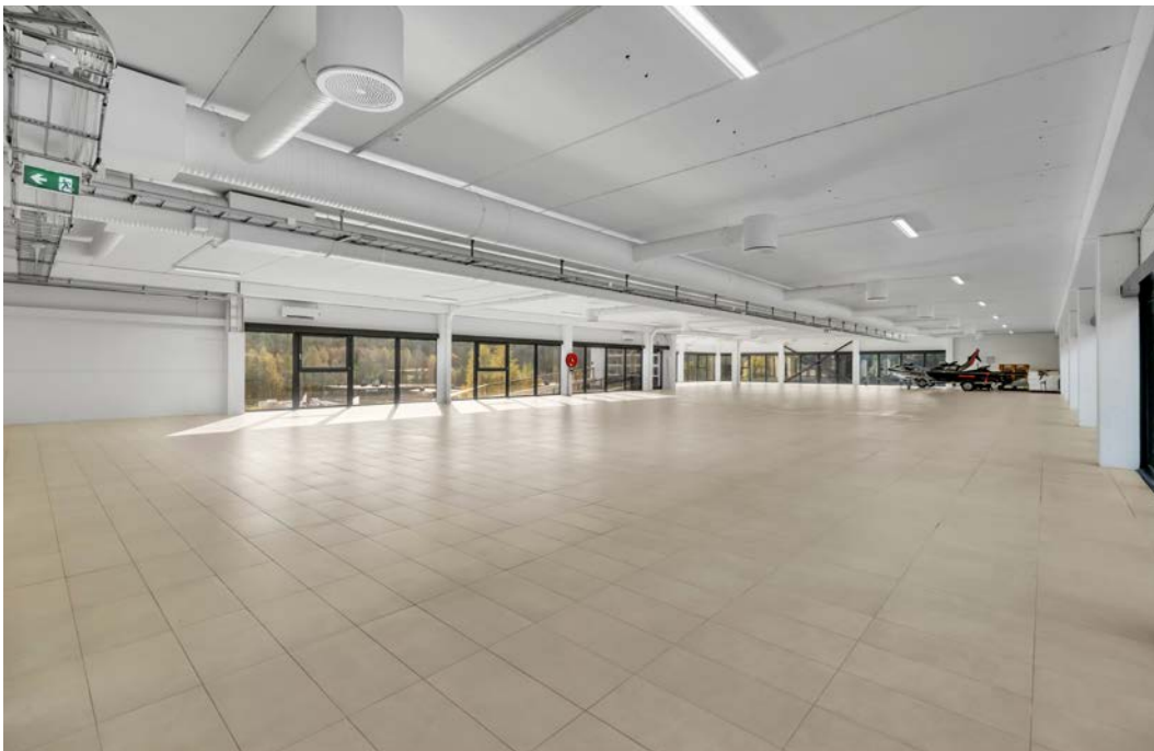
Åpent areal 3 etasje