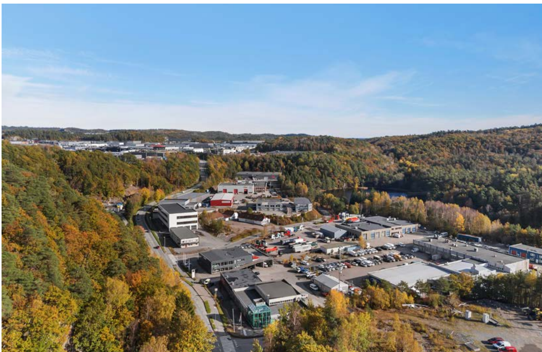
2500 kvm med lokaler fordelt på 3 etasjer