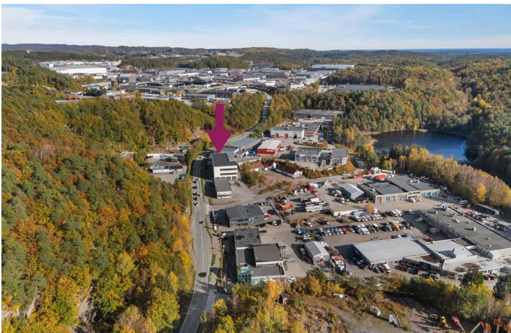
Bygget ligger sentralt plassert med inngangen til Sørlandsparken - Sørlandets største næringspark