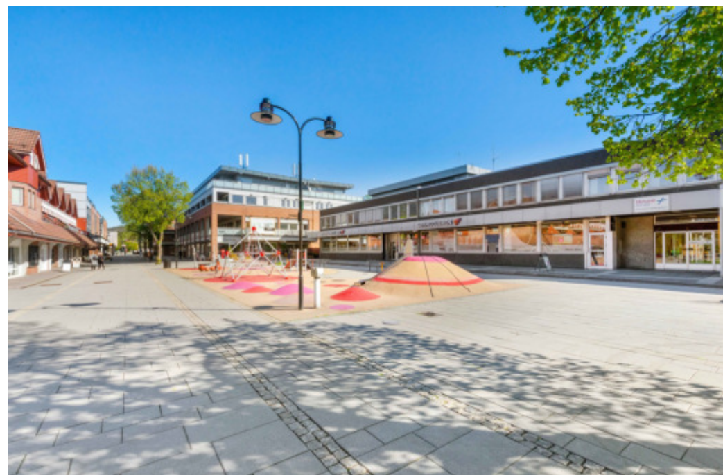
Ca. 300 kvm. med kontorlokaler "midt" i Vennesla sentrum.