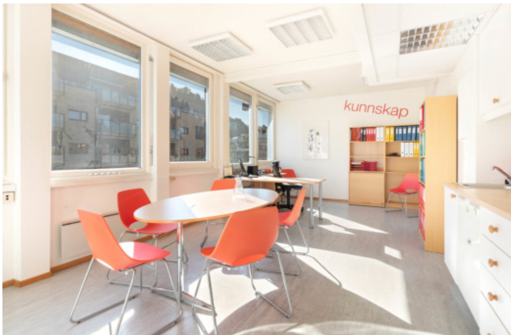
Ekstra kontor som er mulig å leie i tillegg.