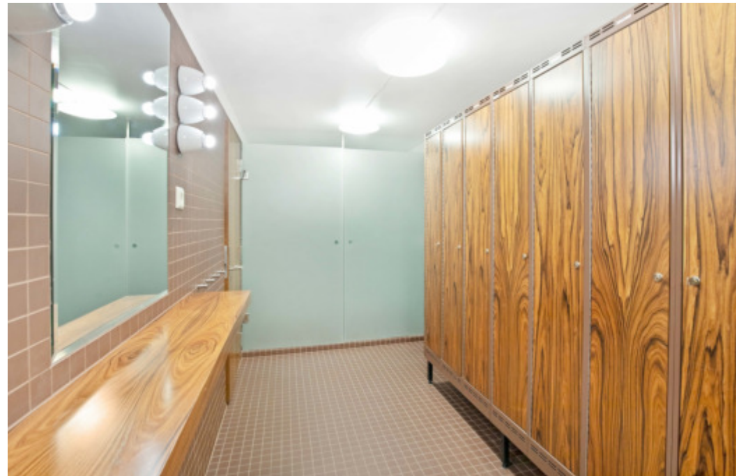
Felles garderobe i byggets u.etc.