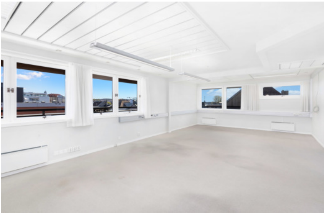
Kontorene innbyr til fleksible løsninger.