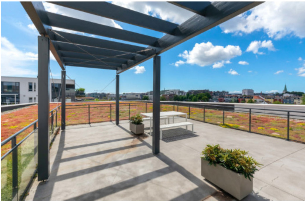
Flott takterrasse. Nyt lunsjen ute på godværsdager. Flott utsikt til sentrum.