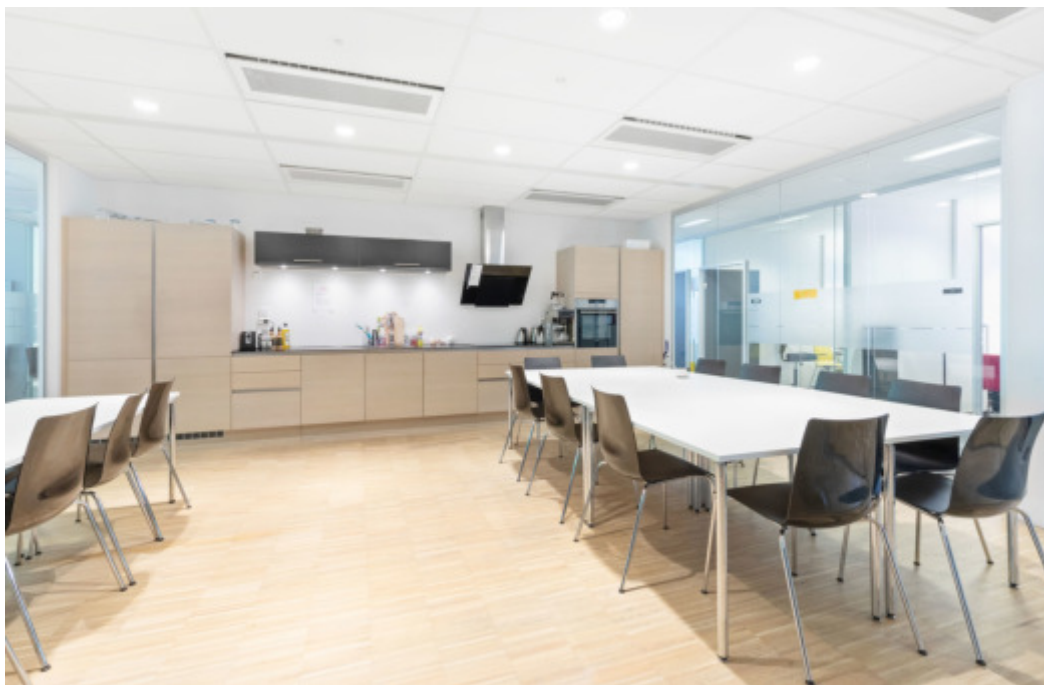
Spiserom med kjøkken.