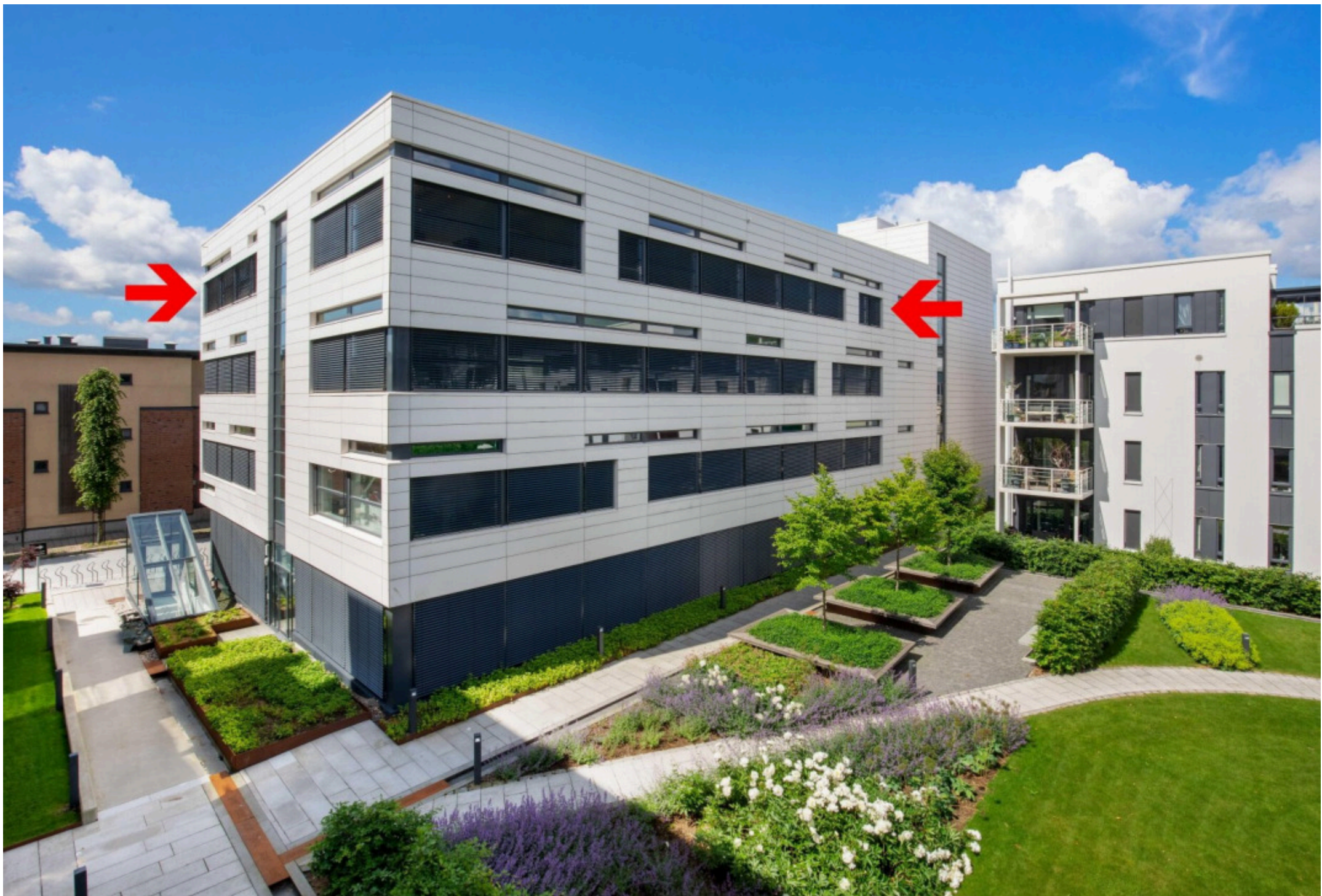
Kjøita er et av Kristiansands fineste områder på Nedre Lund.