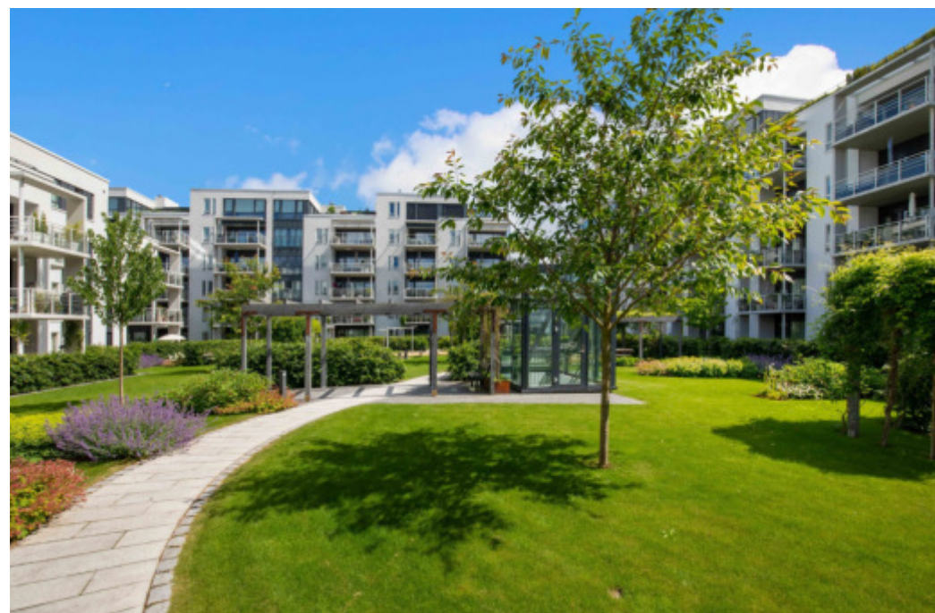
Secret garden med flotte uteområder bak bygget.