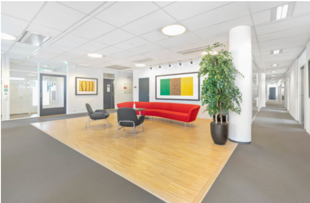
Foajeen i 4.etg.