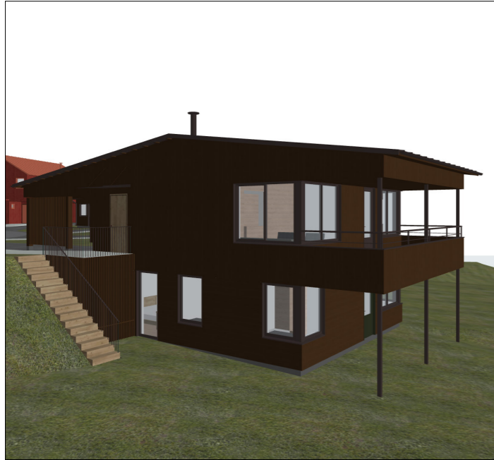
Eneboliger - Type A