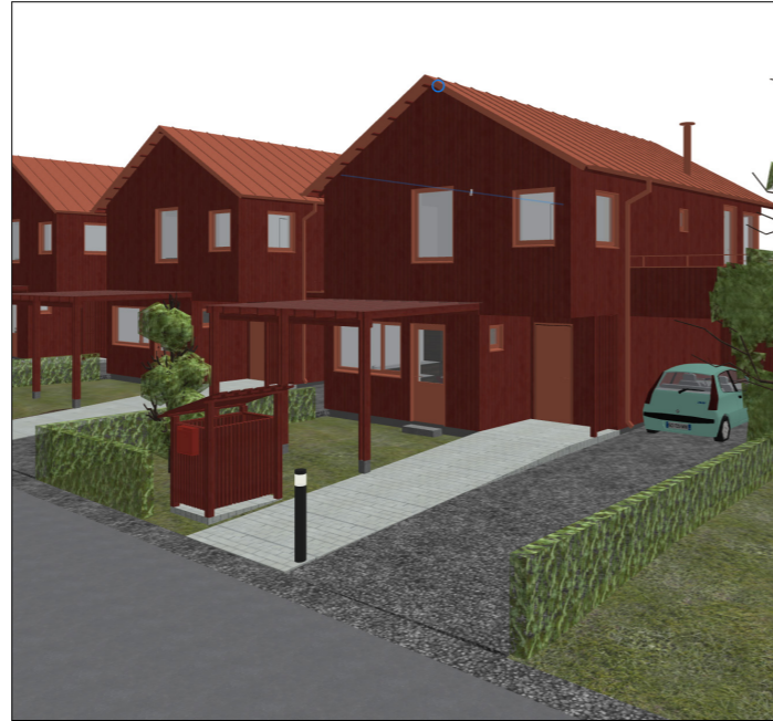
Rekkehus - Type B