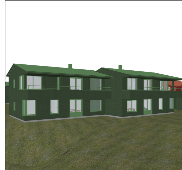
Firemannsboliger - Type C