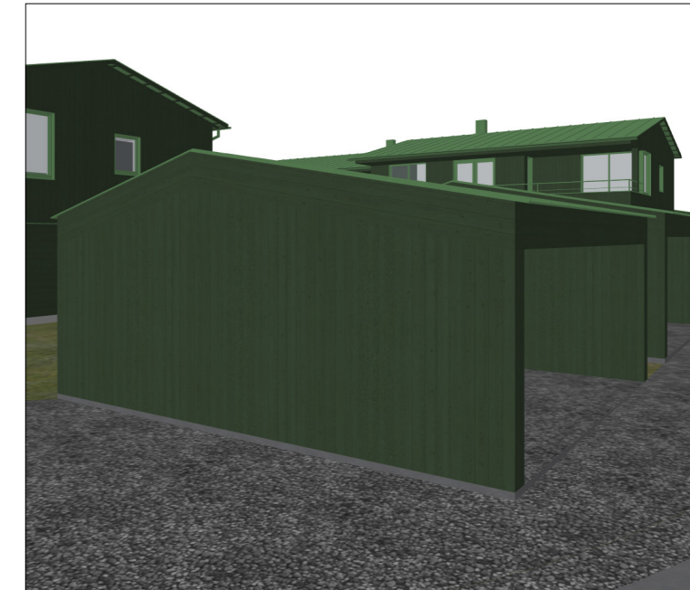
Carporter - Type D