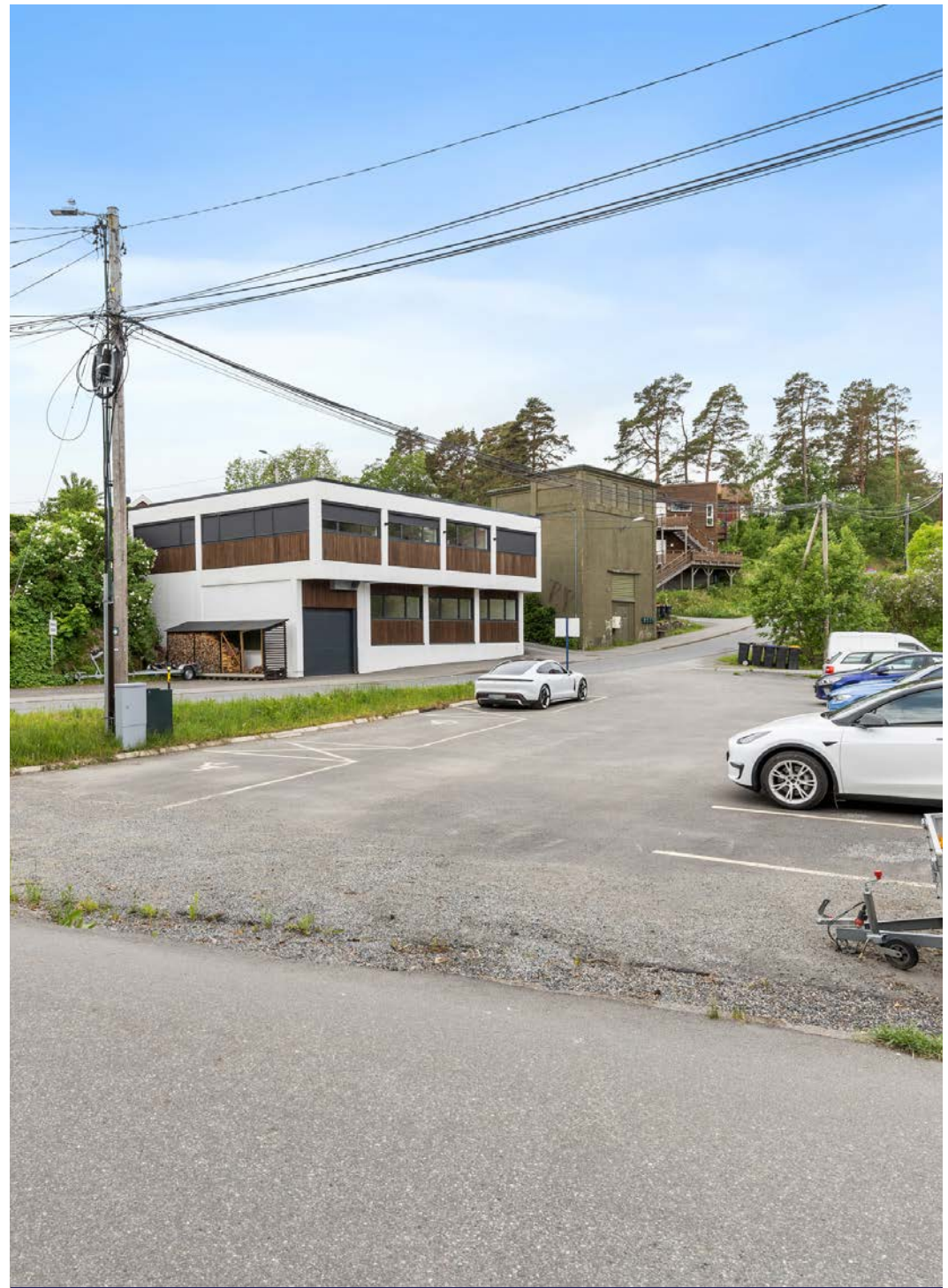
Godt med parkeringsplasser rett ved bygget.