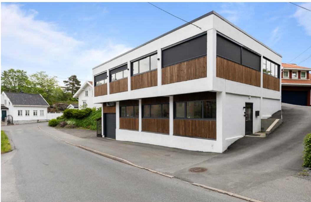
Innholder: 1.etg: Gang, 2 cellekontorer, 2 doble cellekontorer, kjøkken, 2 bad med dusj, spiserom (showrom), bod og bøttekott.