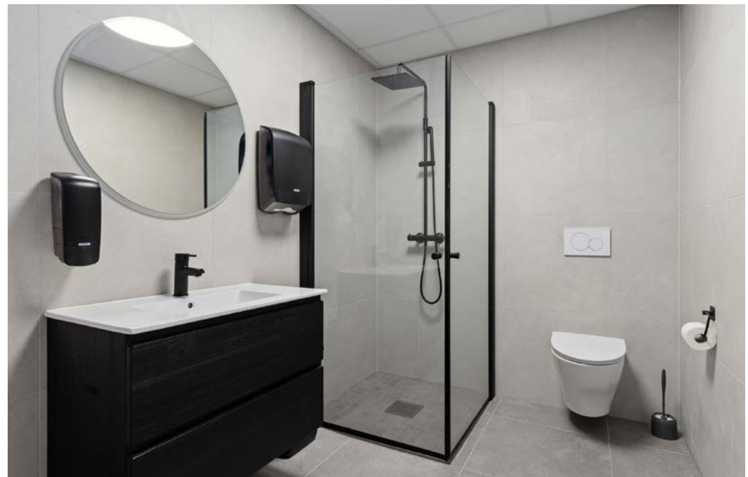
Bad med dusj x 2.