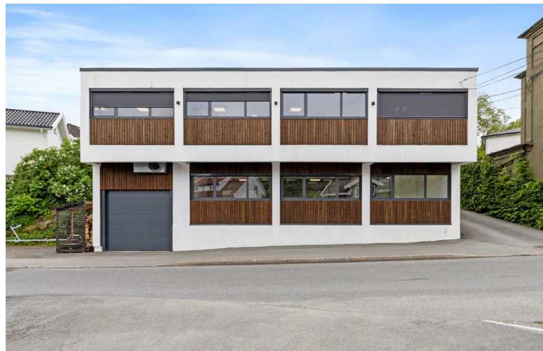
Flotte nyoppussede kontorlokaler på 175 m2 til leie rett ved Arendal sykehus.