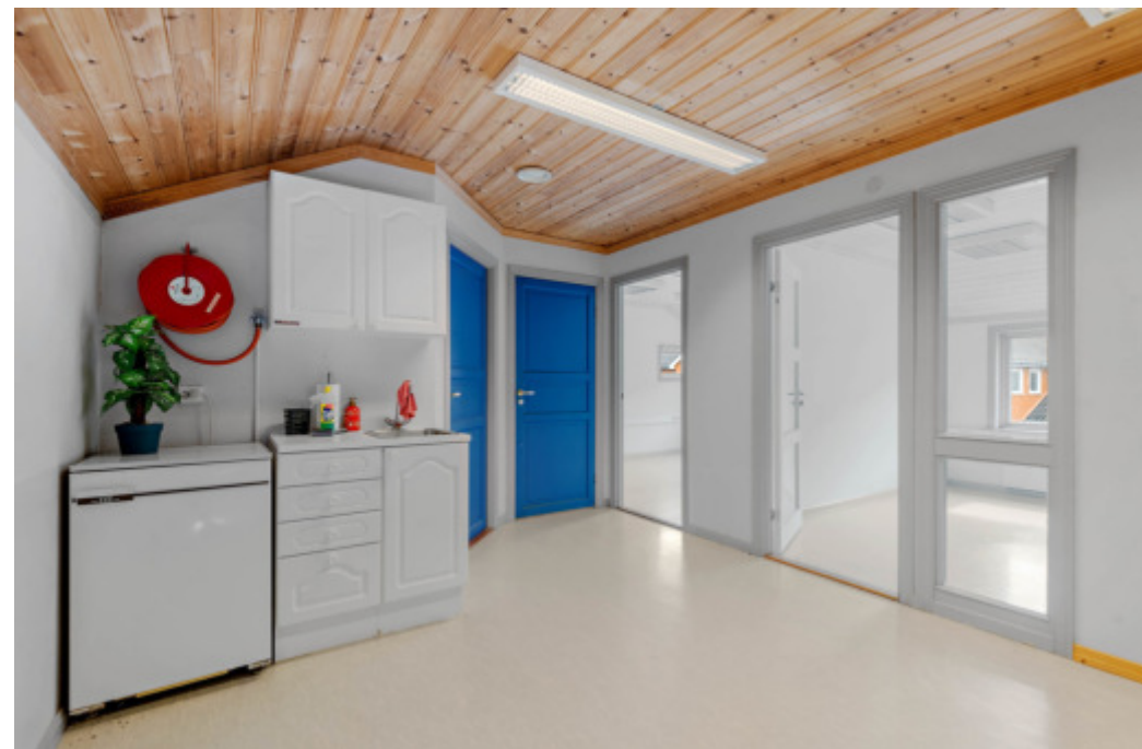
2.etg. Kontorer med felles kjøkken/spis og bad.