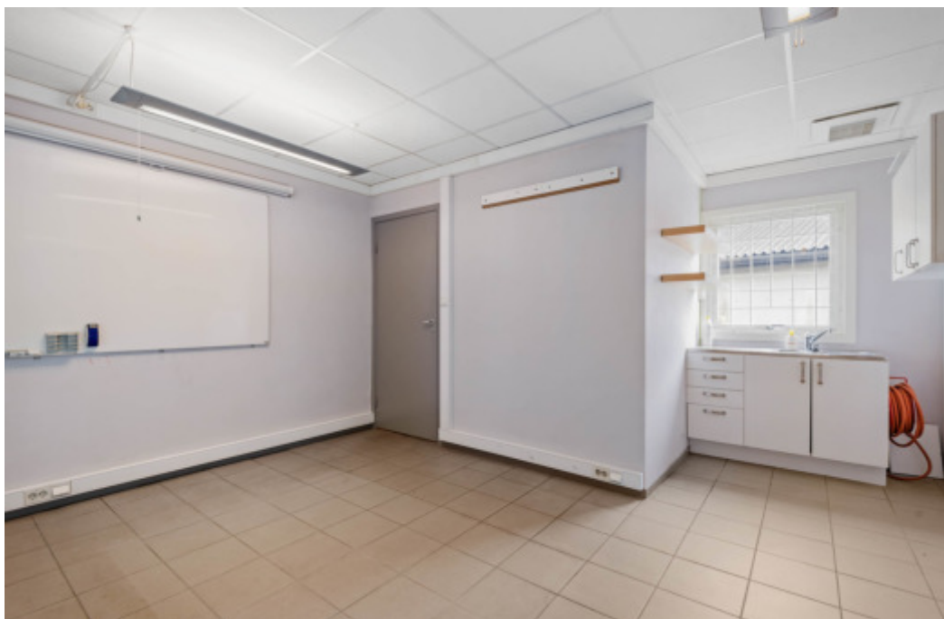
8 Butikk med kontorer og stor garasje Her med spiserom.