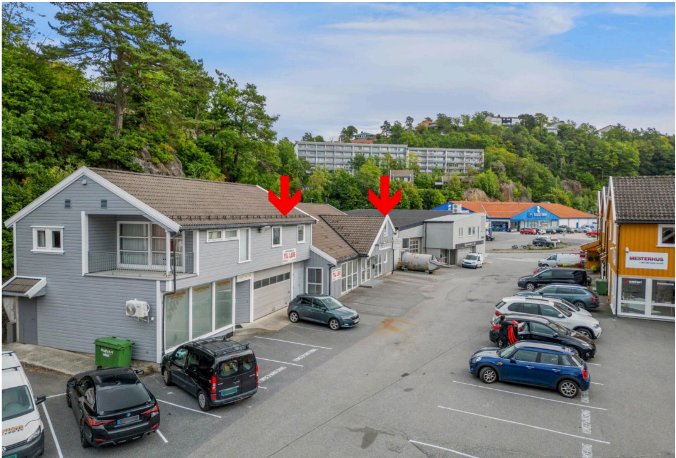
6 Meget sentral beliggenhet og godt eksponert næringsseksjon på Myrene mellom Arendal sentrum og Stoa industripark.