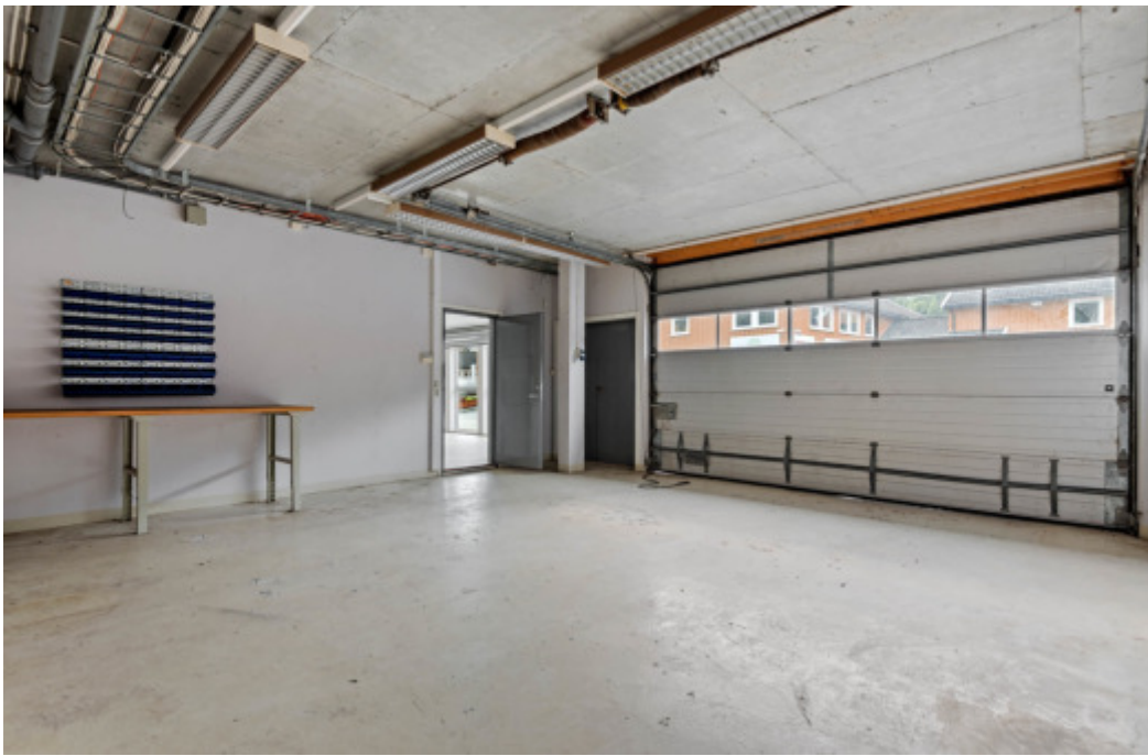
Garasje på ca. 45 m2 med kjøreport.