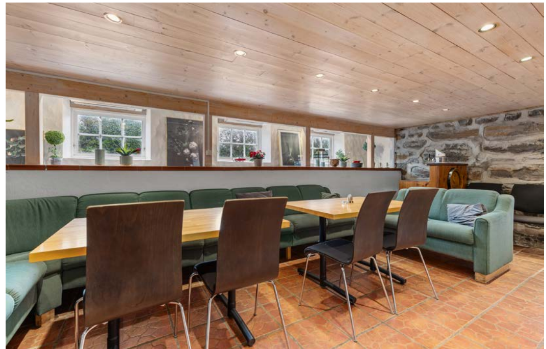
Selskapslokale i u.etg.