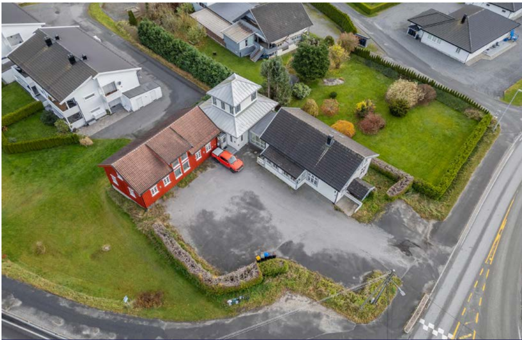
Oversiktsbilde. Godt med parkeringsplasser.