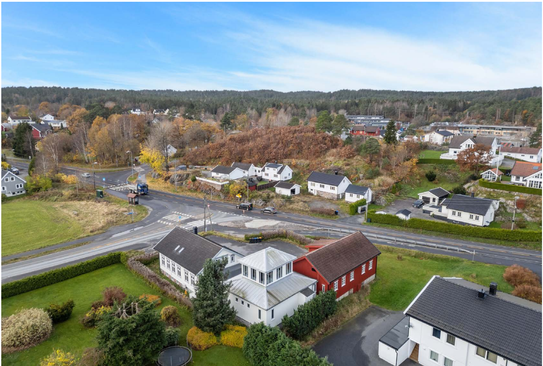
Sørmeglern næring har gleden av å presentere for leie flotte kontorlokaler på Asdal i idylliske og rolige omgivelser.