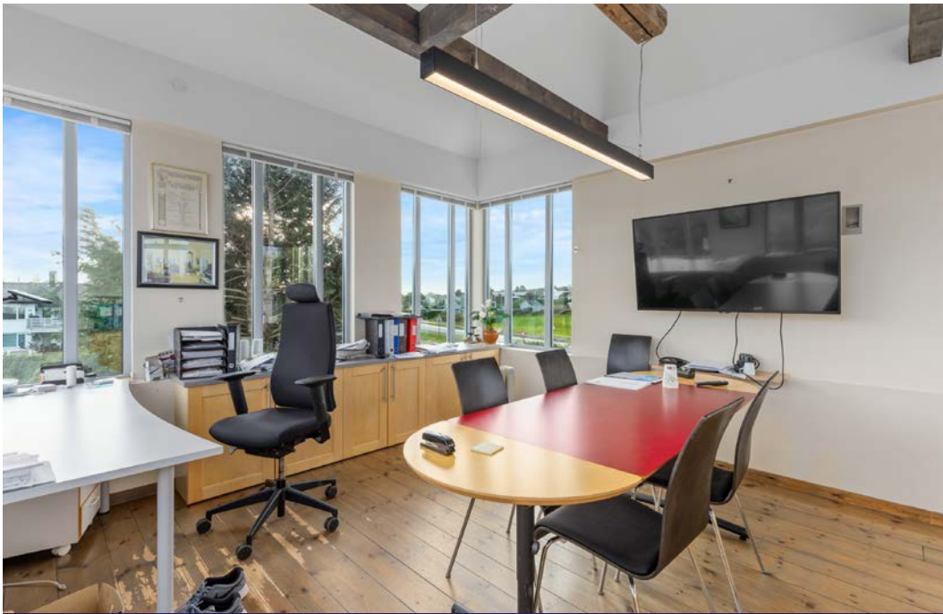
"tårnet" med møterom og kontor.