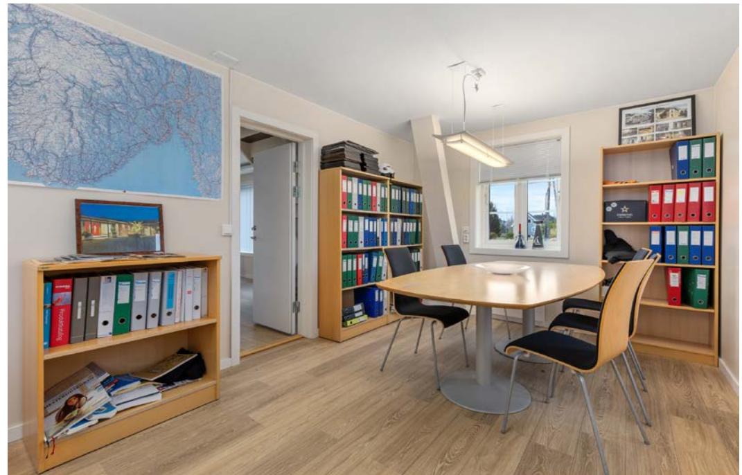
Kontorer med møterom.