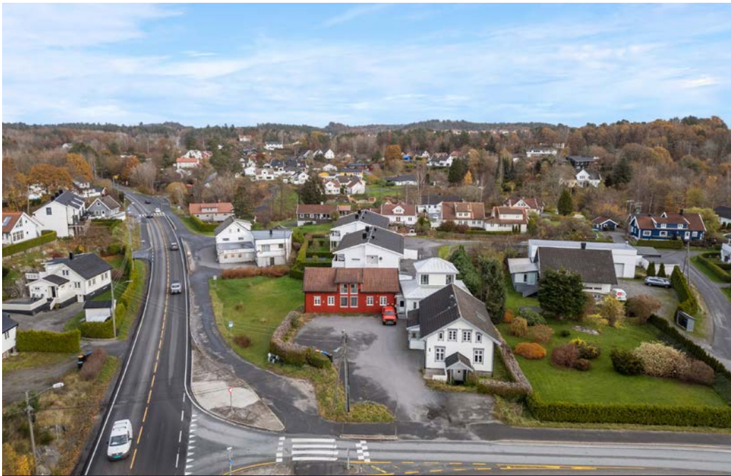
Kort vei til E-18.