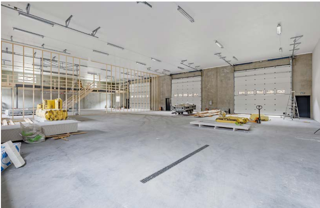
Lager seksjon 2A: 188 m 2 Lager seksjon 2B: 83 m 2