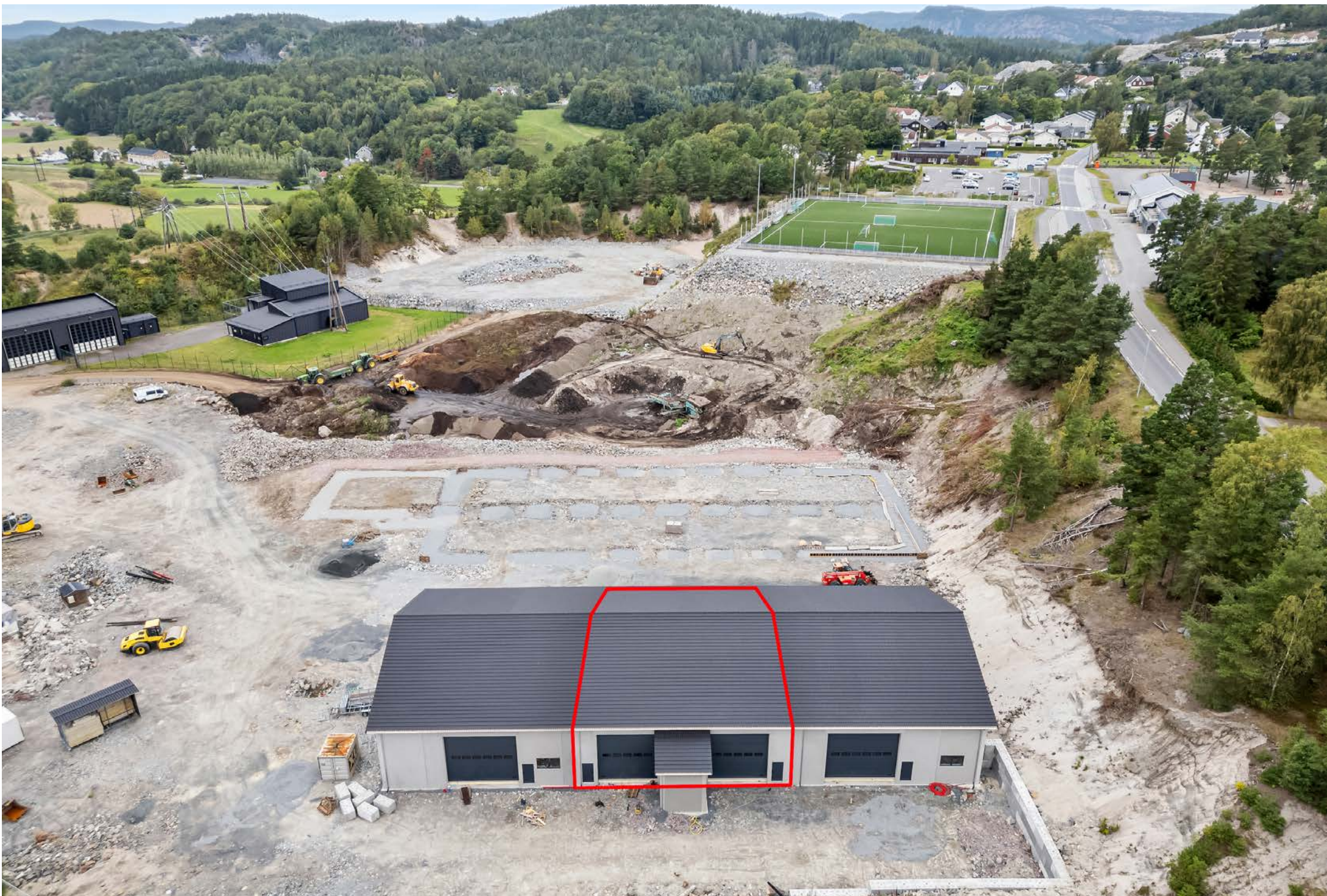
Sørmeqleren næring har gleden av å presentere for leie seksjoner i nyoppført lagerbygg på Landvik Grimstad.