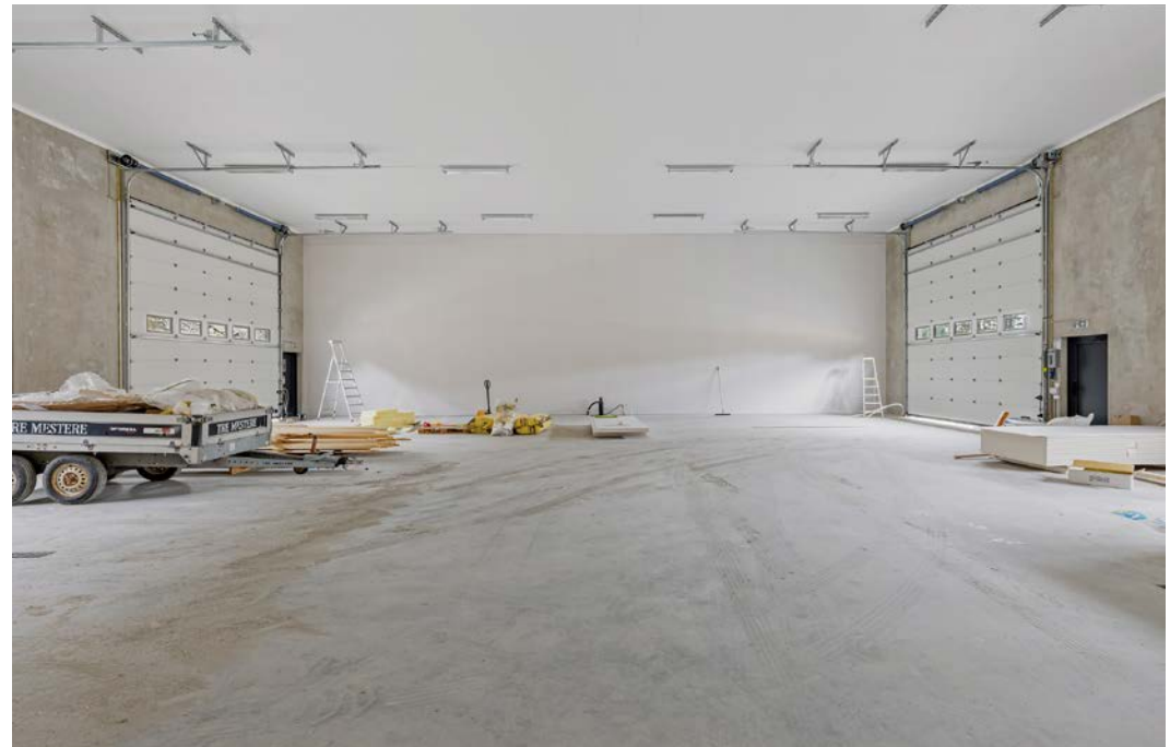
Høyde ca. 6 meter. Alle seksjoner med egen kjøreport.