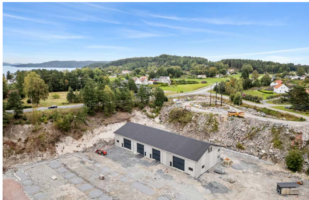
Nyere industriområde Landvik ca. 5 min kjøring fra Grimstad sentrum.