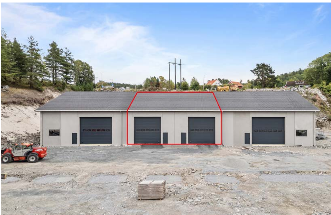
Nyere industriområde Landvik ca. 5 min kjøring fra Grimstad sentrum.