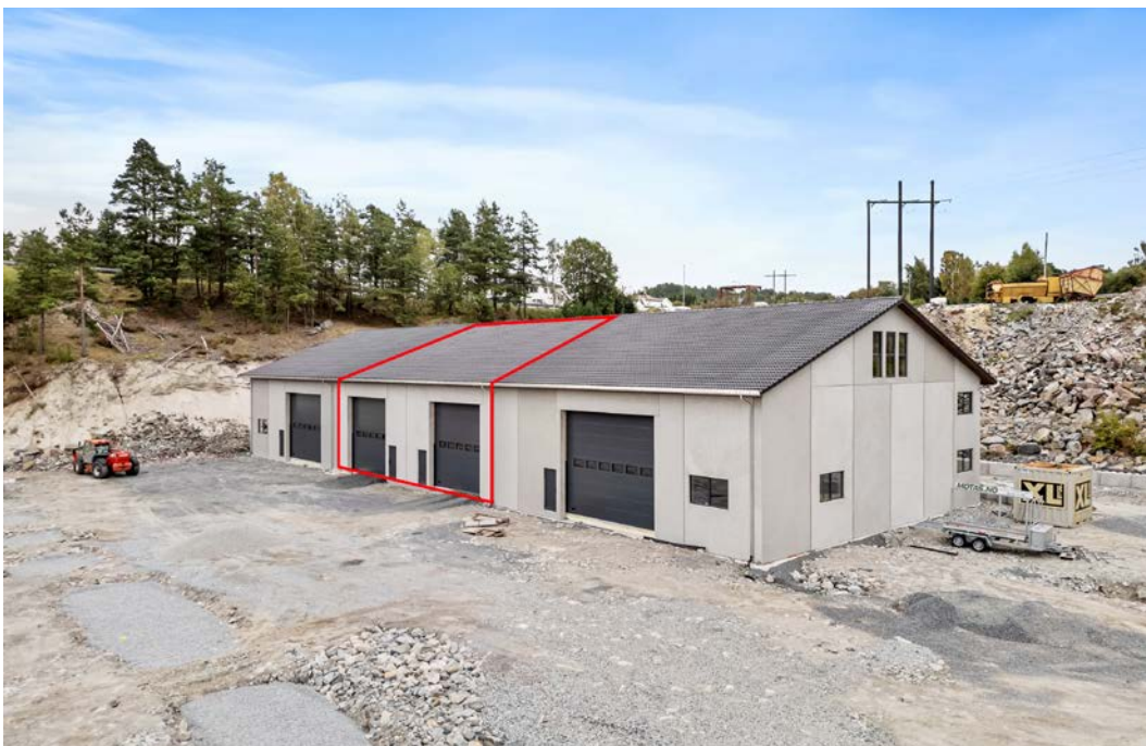
Her kan man leie seksjoner fra ca. 83 m 2 til ca. 350 m 2 , alt etter ønske.