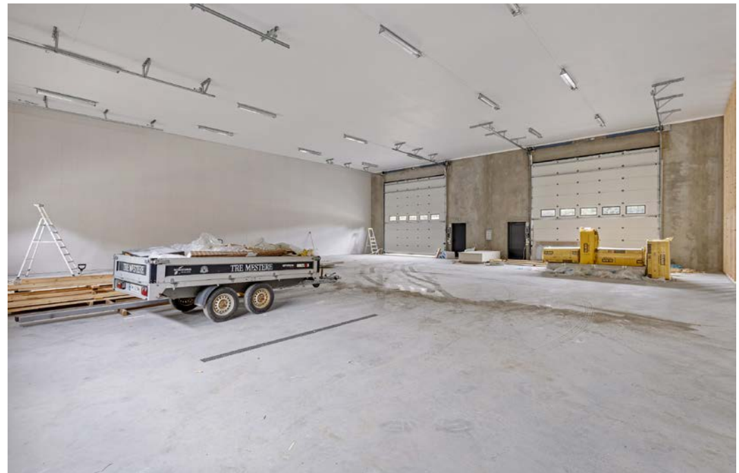
Nyoppført bygg med isolerte betongelementer og isolert tak.